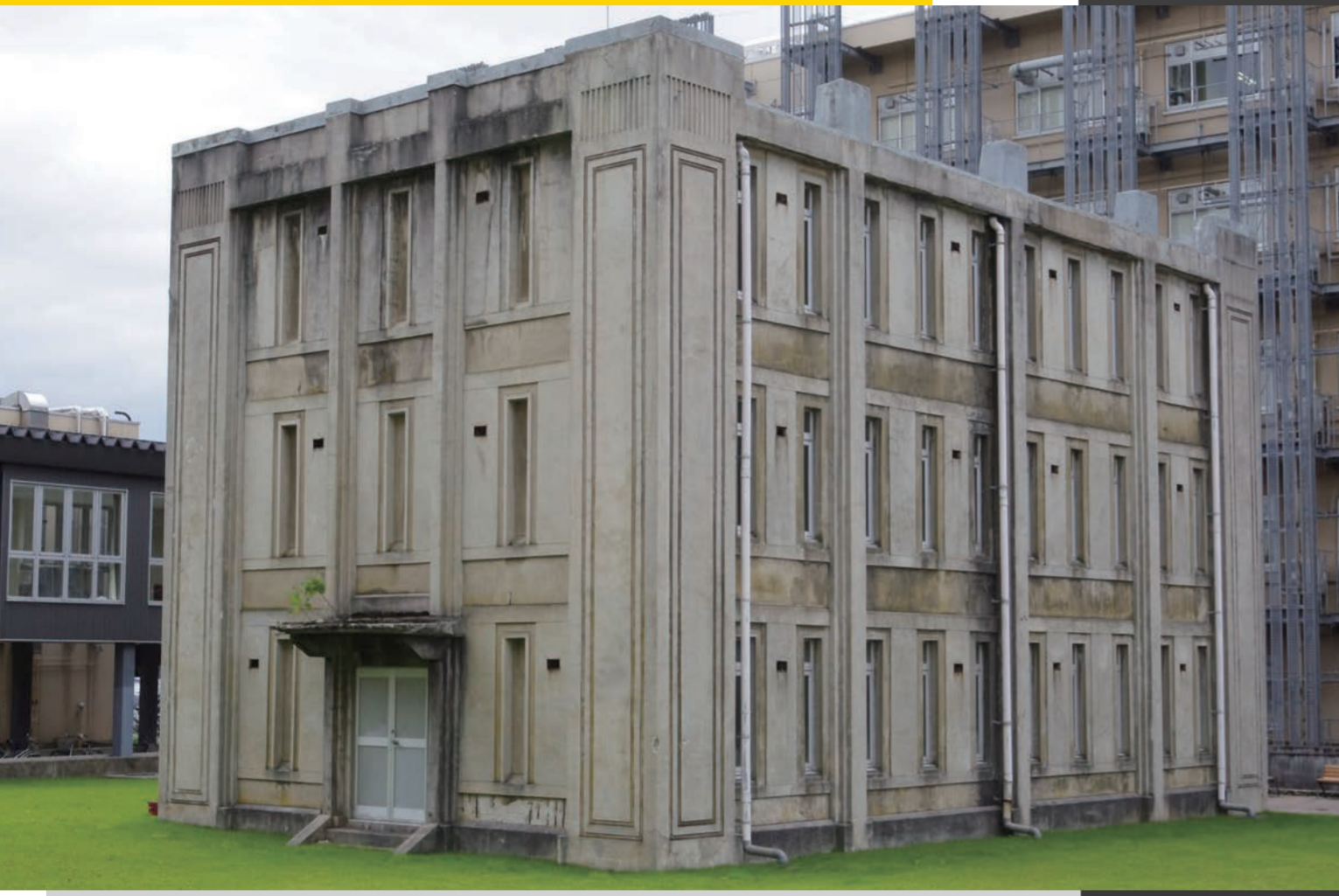
金沢大学医薬保健学域医学類旧書庫