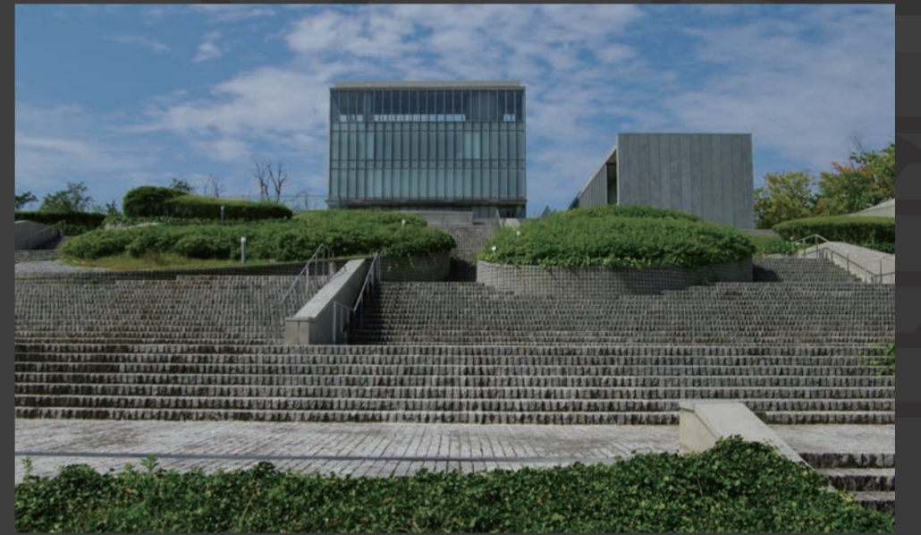
石川県西田幾多郎 記念哲学館