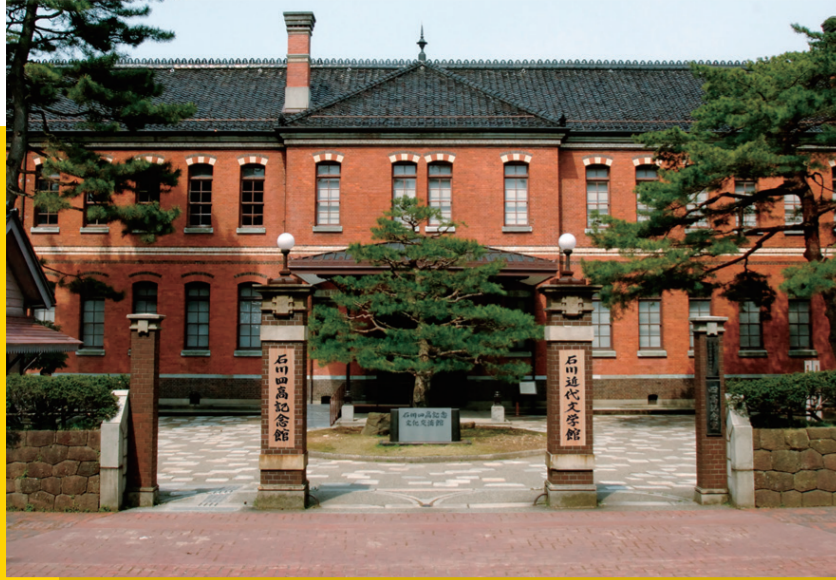
石川四高記念文化交流館