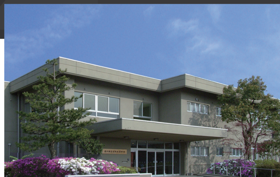
石川県立自然史資料館

●お問い合わせ TEL: 076-264-5215 金沢大学資料館 E-mail: museum@adm.kanazawa-u.ac.jp